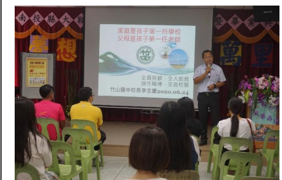
分享親子教育理念