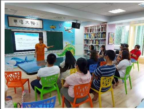
講師與家長互動良好