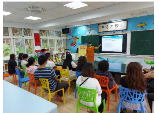
家長們踴躍參加親職講座活動