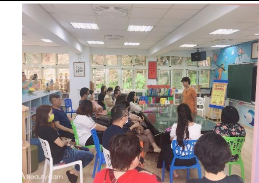
親子閱讀良方經驗分享