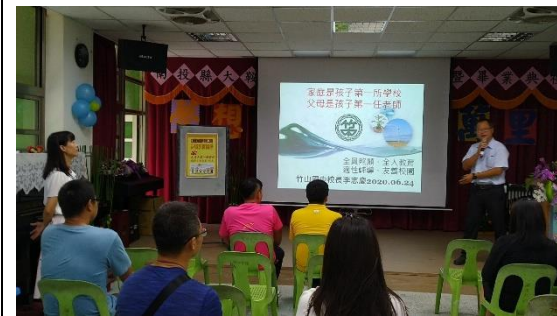
講師分享感謝親職教育經驗