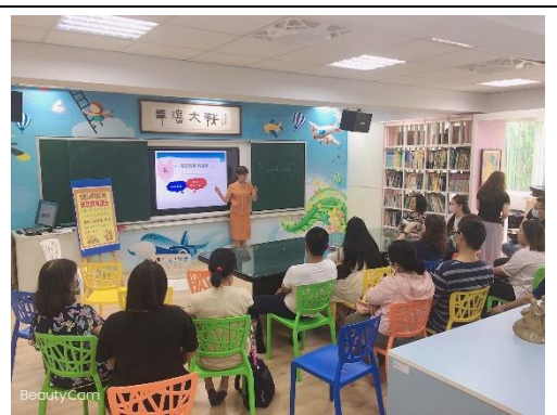
家長熱情參與親職講座