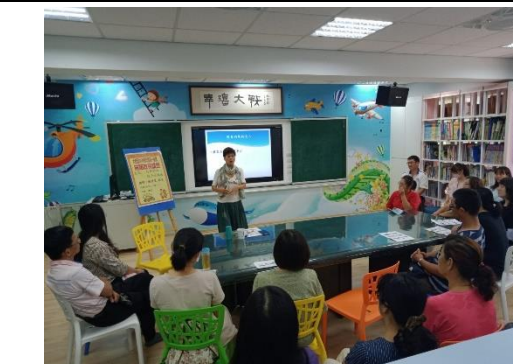
參與親職講座提供諮商服務