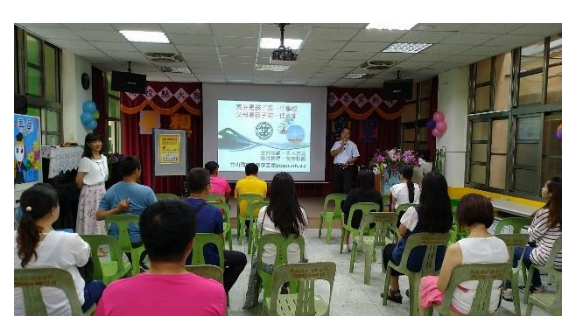
家長和講師互動良好