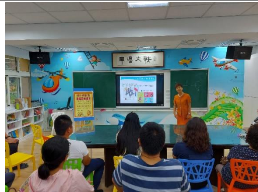
家長們踴躍參加親職講座活動