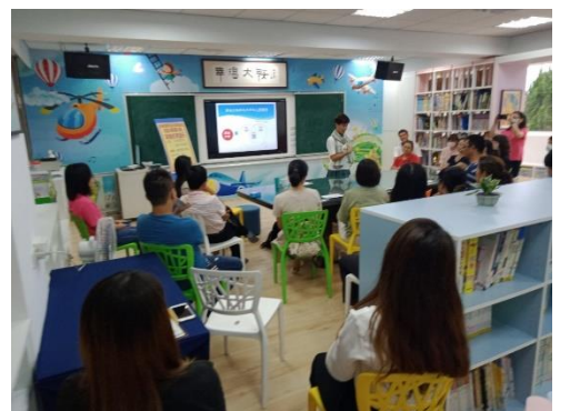
家長們踴躍參加親職講座活動