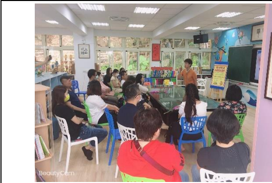
全體親師生大合照