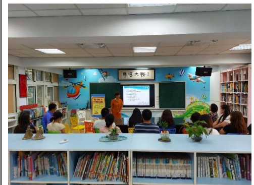
施校長講授增進親子關係的要領