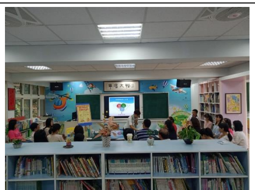
家長熱情參與親職講座