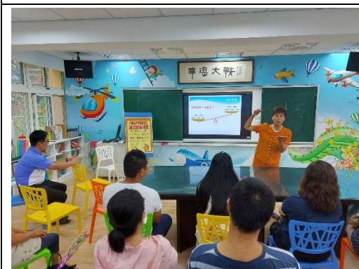
參與親職講座收穫良多