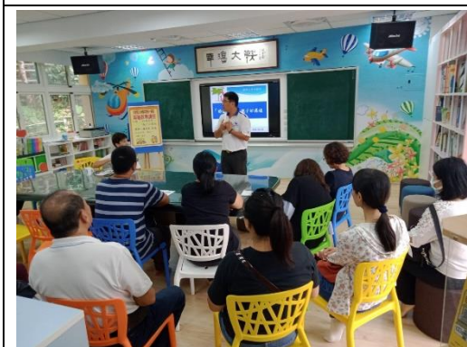
介紹親職講座講師