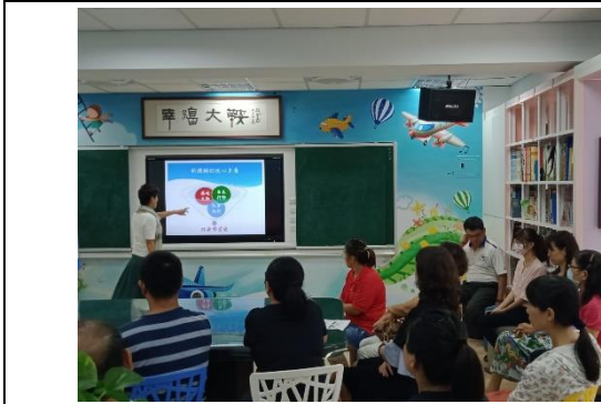
分享親子教育經驗