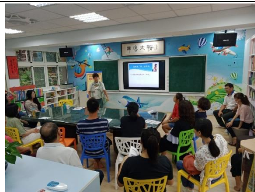
家長們踴躍參加親職講座活動