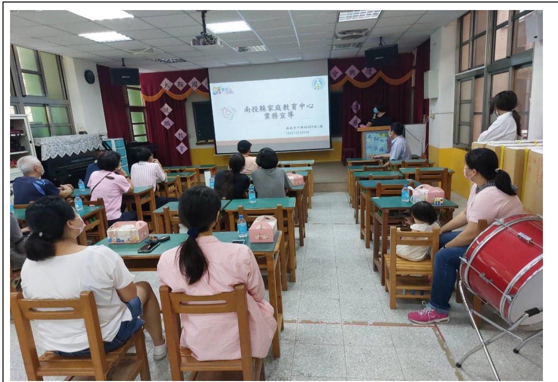
利用家長大會對家長宣導家庭教育中心諮詢專線