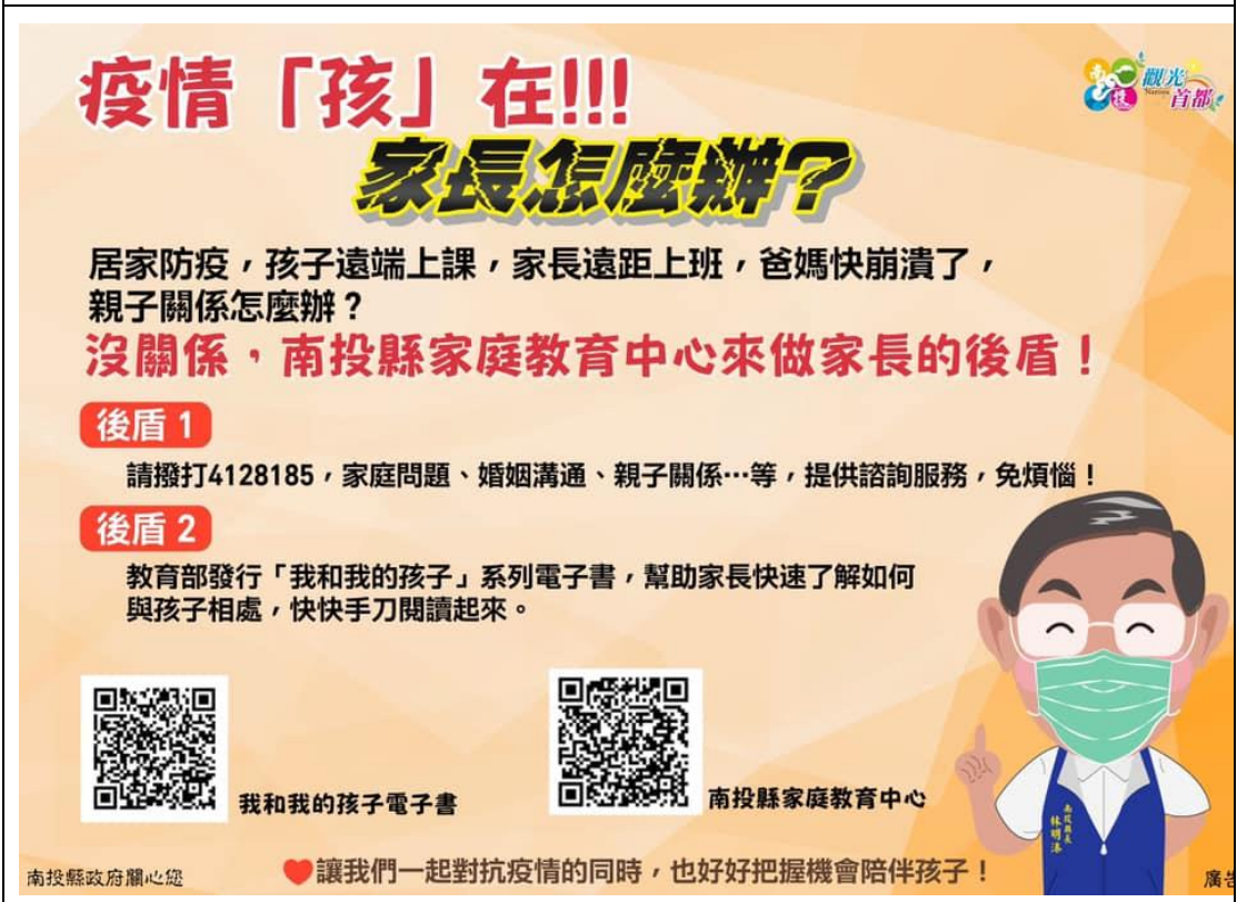
疫情讓家長壓力變大，將相關資訊 LINE 給家長