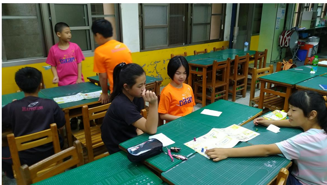
學習扶助-桌遊學英文