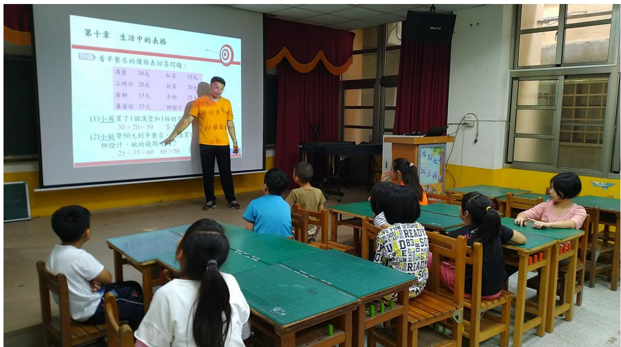
學習扶助利用電子教科書上數學