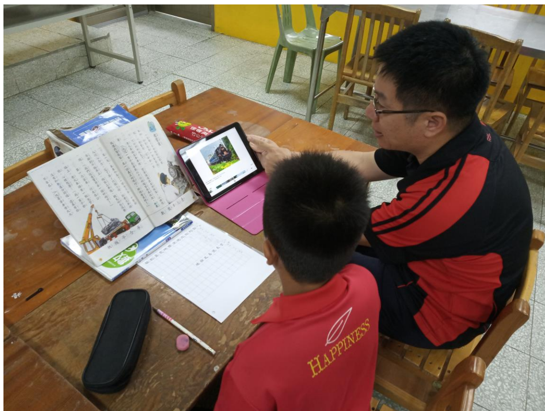
針對低成就學生個別指導