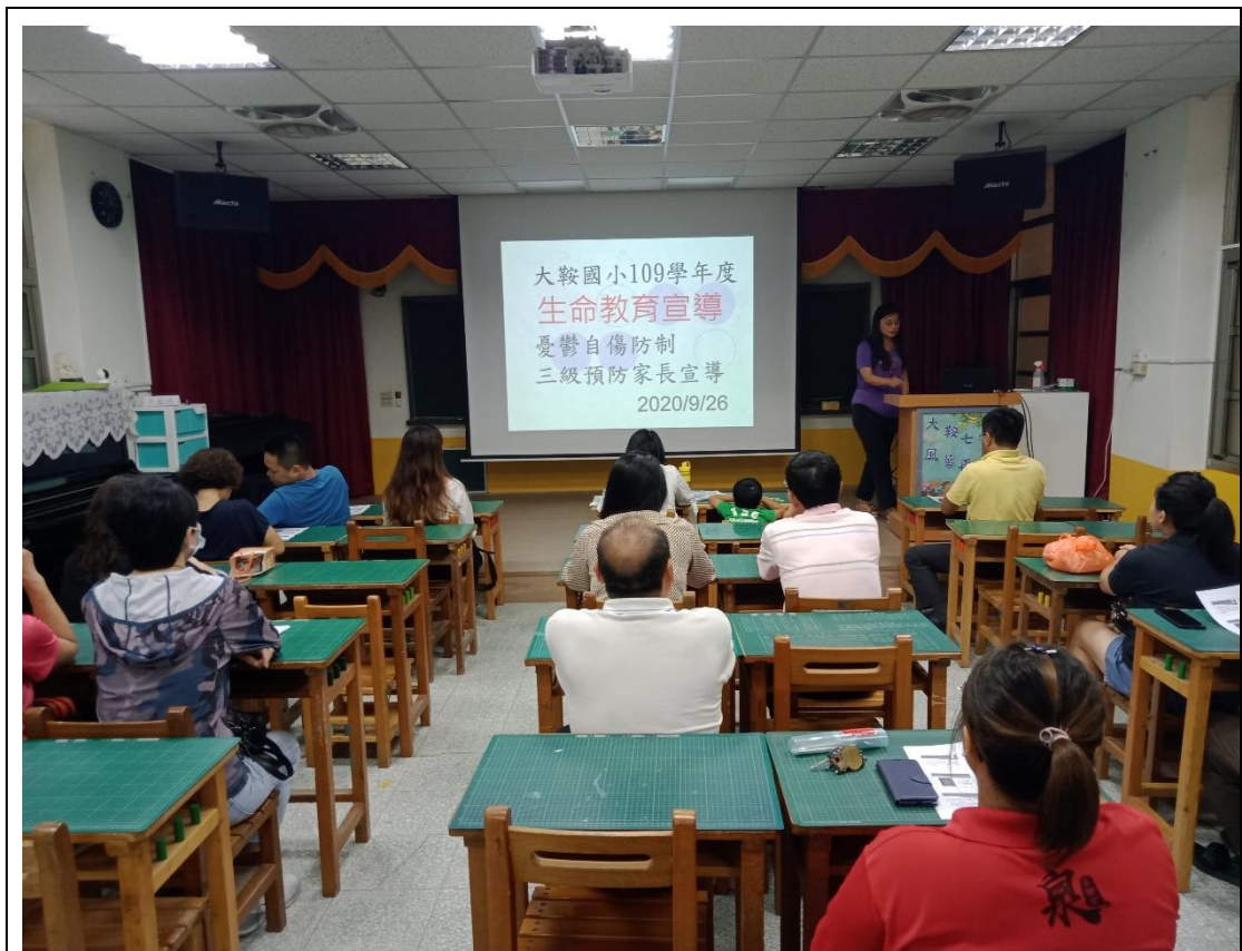
利用家長大會對家長宣導生命教育