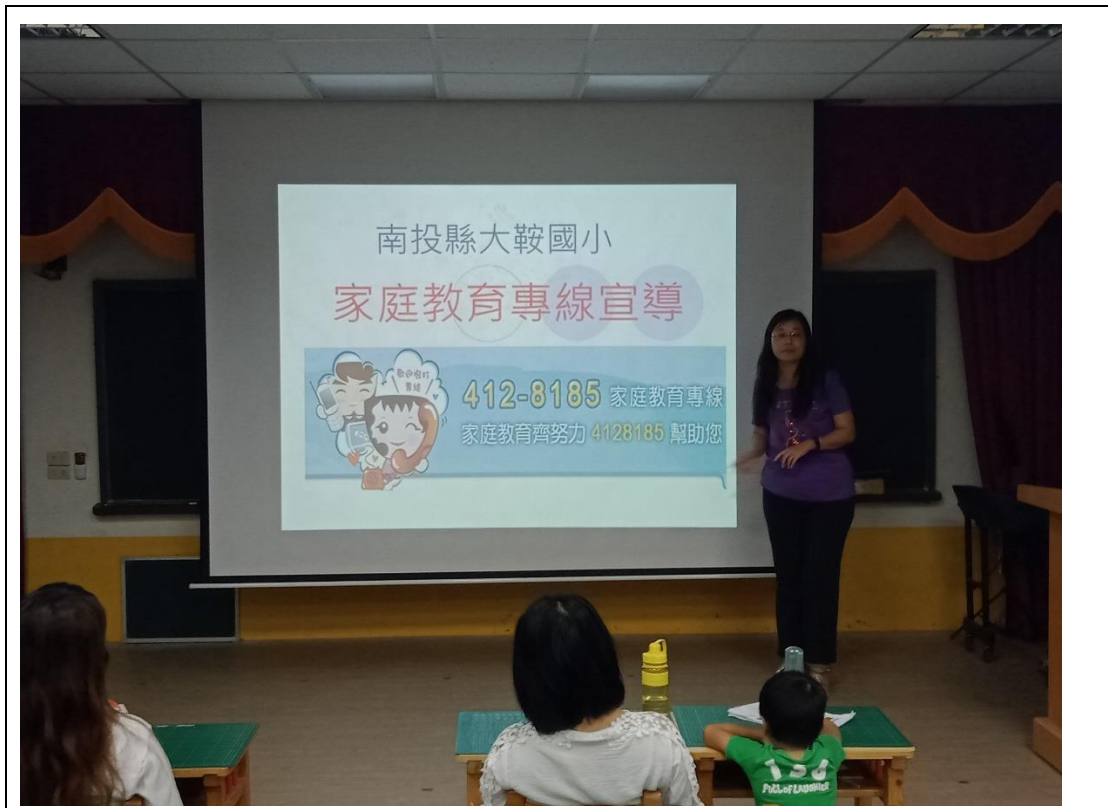
利用家長大會對家長宣導家庭教育中心諮詢專線